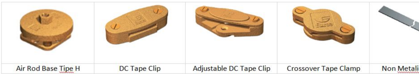
Air Rod Base Tipe H